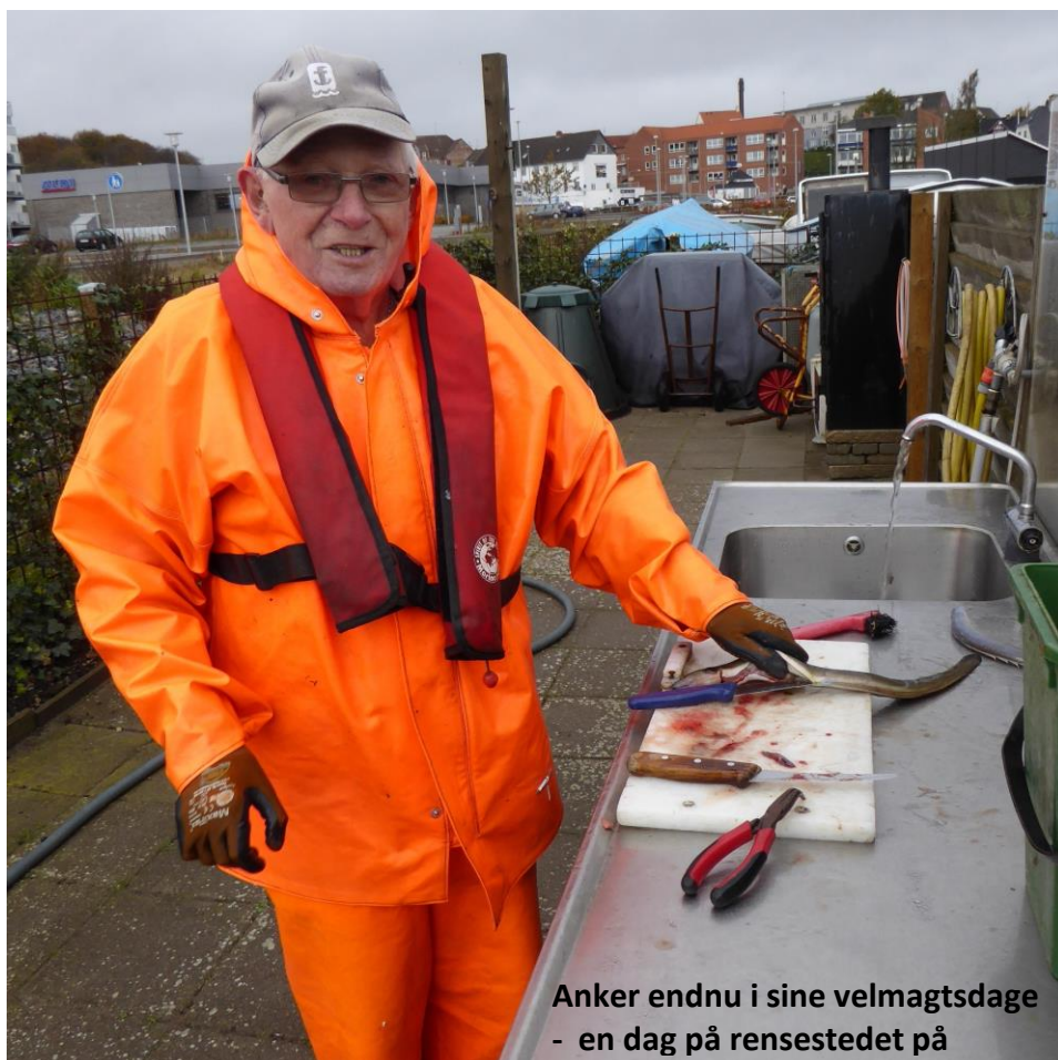
Anker endnu i sine velmagtsdage - en dag på rensestedet på

En væsentlig del af hans liv her på Broen foregik ude på fjorden, hvor han elskede at være. Fiskegrejet på plads og så af sted i den lille båd.