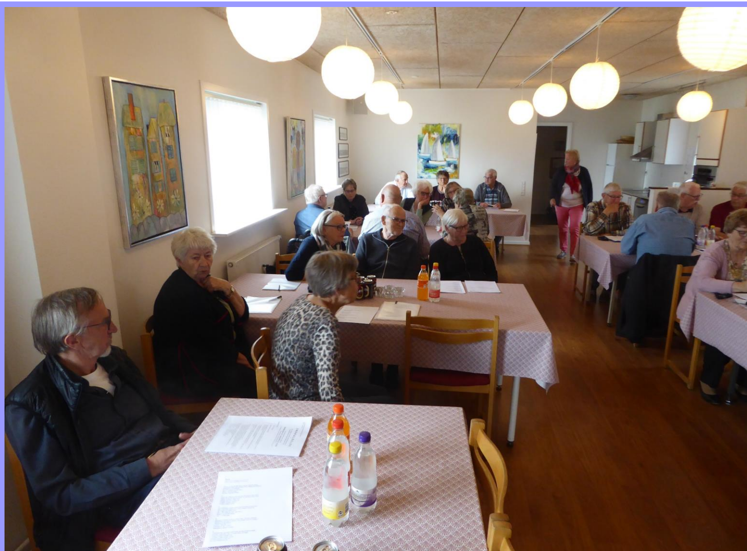
Generalforsamlingen er ved at være klar til start.

Med login på siden får man adgang til det, man søger. Har man glemt sit login må man spørge sig for.