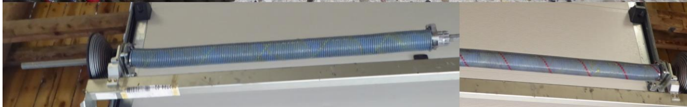
Den knækkede fjeder og de to nye. Læg i øvrigt mærke til det politisk ukorrekte: den fjeder med det grønne bånd sidder til venstre, den med det røde bånd sidder til højre. Nå, forhåbentlig går det.