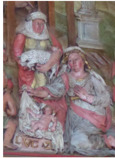
Detalje fra billedet