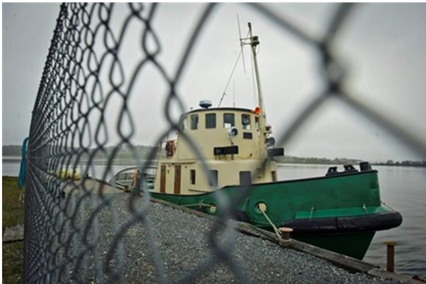
Slæbebåden og isbryderen "Jacob Peter" ved kaj i Hadsund.

Igennem mange år var broen og stedet, hvor vi i Andelsboligforeningen "Marcussens Bro" nu har vores fælleshus, hjemsted for fjordens fyr- og vagervæsen. I værkstedet repareredes koste og vagere, og ved broen lå