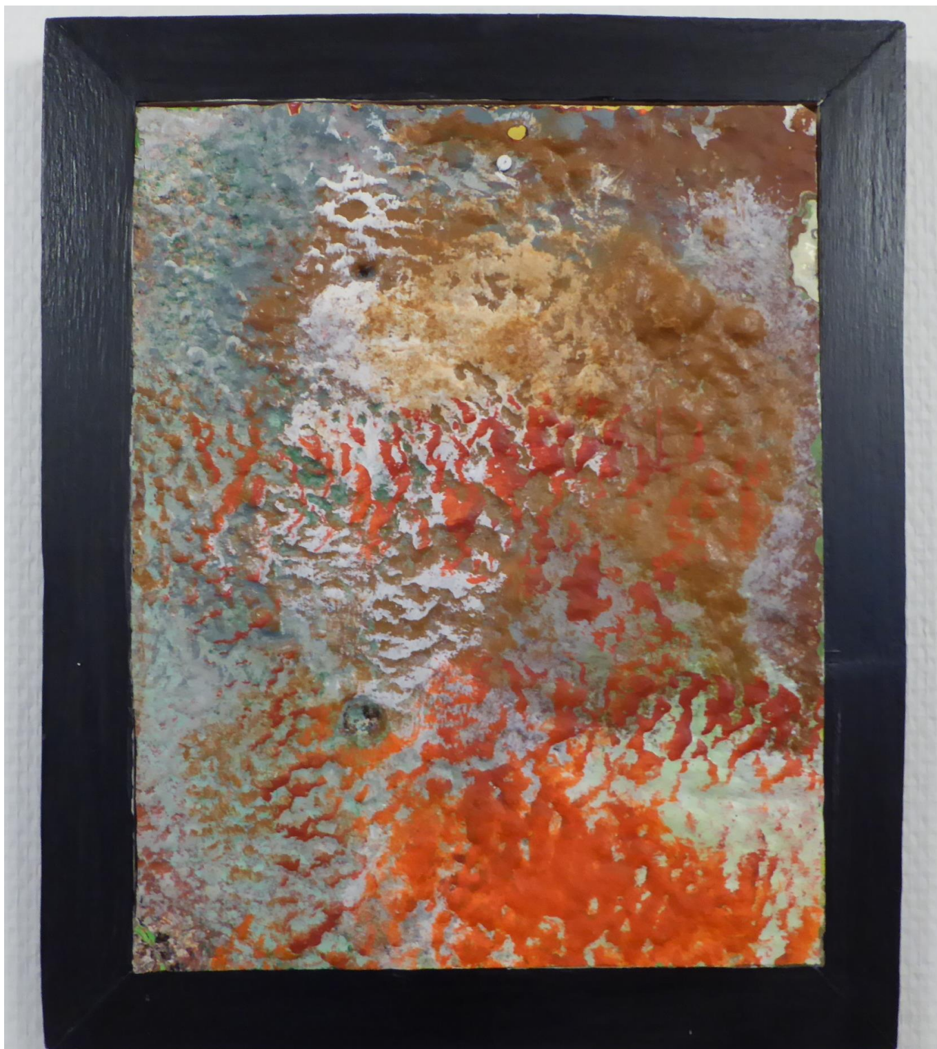
Et lille stykke væg med den oprindelige maling fra fyr- og vagervæsenets tid.

Navnet Marcussens Bro fremgår af et kort fra 1898 netop på det sted, hvor nu byggeriet “ Marcussens Bro ” ligger.